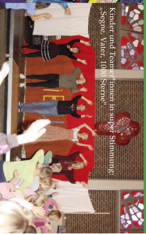
Kinder und Teamer*innen in super Stimmung: „Segne, Vater, 1000 Sterne“.