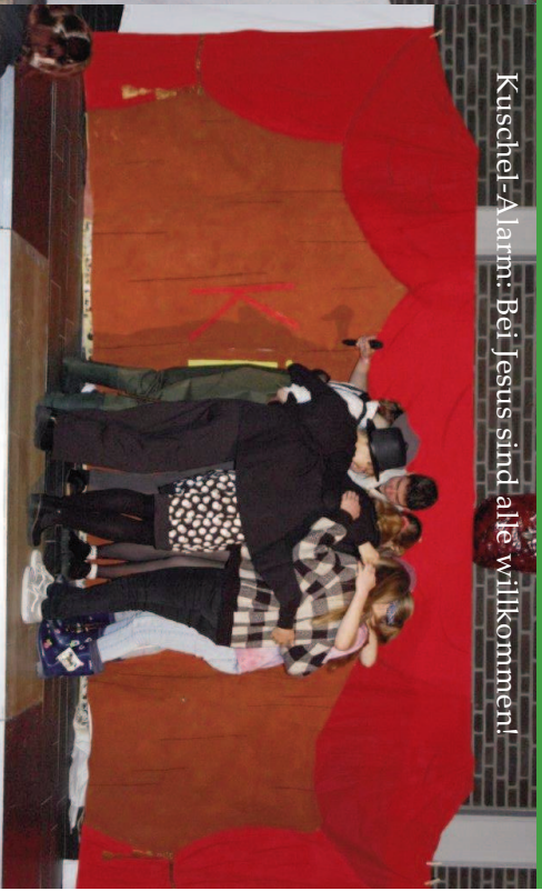
Kuschel-Alarm: Bei Jesus sind alle willkommen!