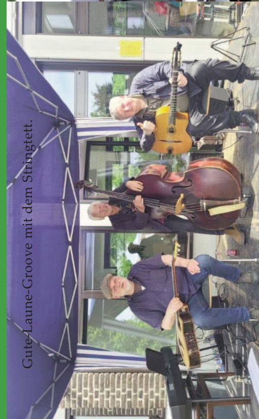
Gute-Laune-Groove mit dem Stringtett.