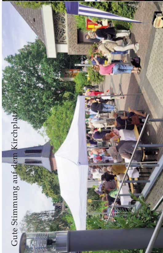
Gute Stimmung auf dem Kirchplatz.

„Zusammen ist man stark“ – Gemeindefest 2023