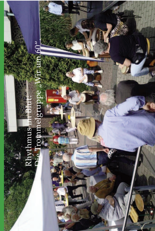
Rhythmus mit Blut. Die Trommelgruppe „Wir um 60“

„Zusammen ist man stark“ – Gemeindefest 2023