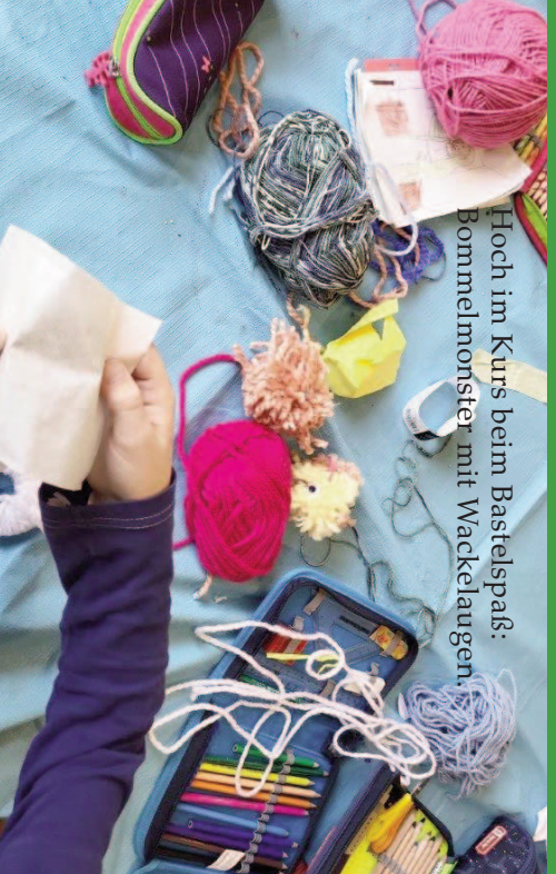
Hoch im Kurs beim Bastelspaß: Bommelmonster mit Wackelaugen.