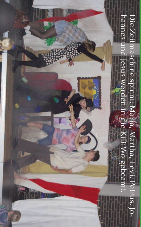
Die Zeitmaschine spint: Maria, Martha, Levi, Petrus, Johannes und Jesus werden in die KiBiWo-gebeant.

www.ev-kirche-hiltrup.de – www.ev-kirche-amelsbueren.de